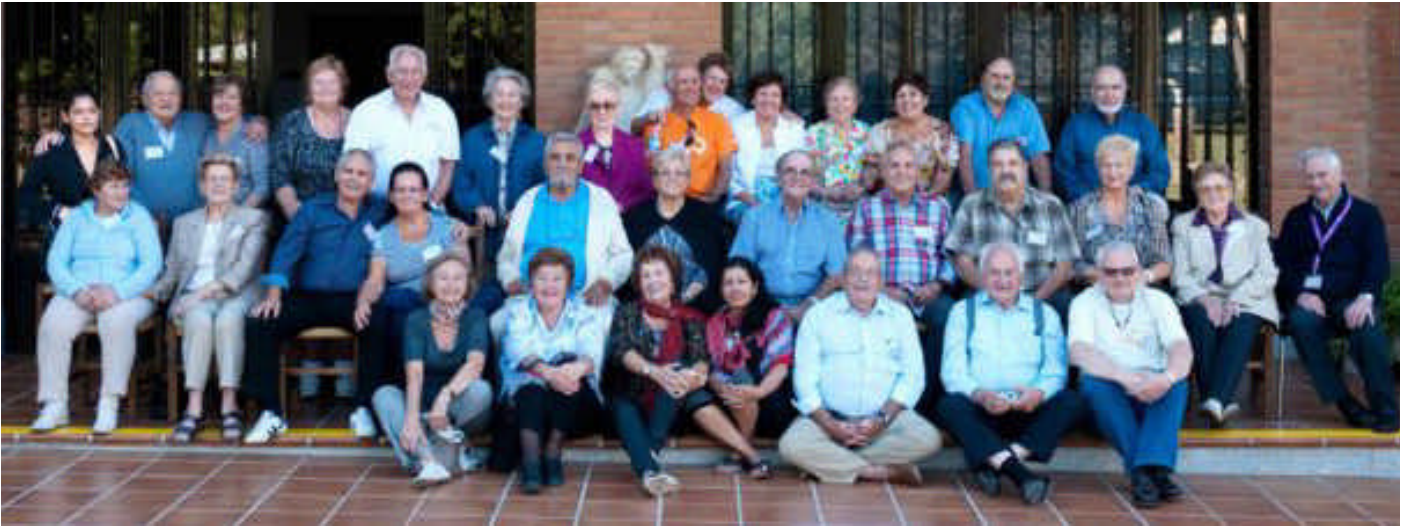
Encuentro del MAS. en Toledo - 8 y 9 octubre 2011