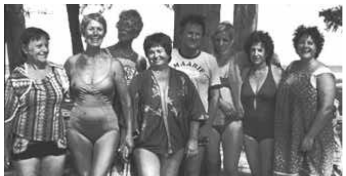
Le Padre aux USA 1981