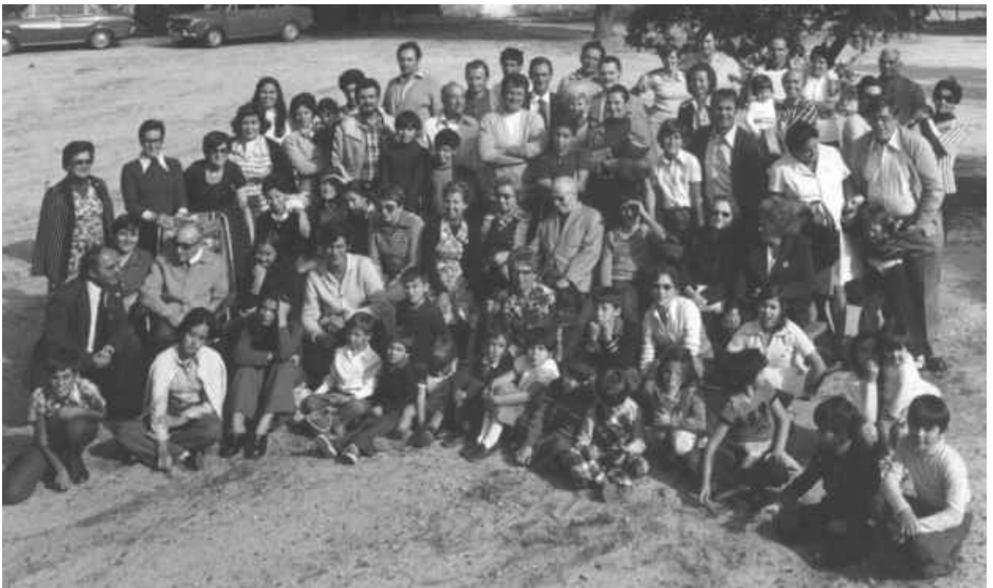
MAS Madrid 1976