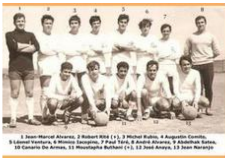
Photo : le Foot au MAS Maarif Association Sportive