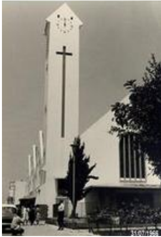
Photo : Notre Eglise, Saint Antoine de Padoue en 1966