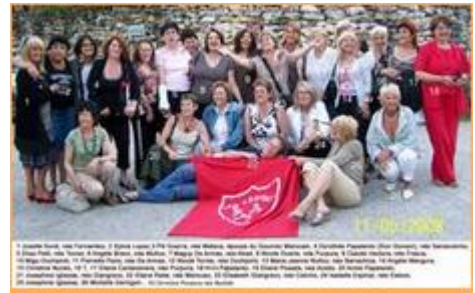
Photo : Nos Jeunes Filles Maarifiennes et leurs Copines à Castries 2008

Noms des Jeunes Filles Maarifiennes et leurs Copines