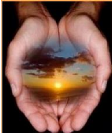
Photo : Vous êtes la lumière du monde..

De l'Évangile selon saint Matthieu (5, 13-16) En ce temps-là, Jésus disait à ses disciples : « Vous êtes le sel de la terre. Mais si le sel devient fade, avec quoi sera-t-il salé ? Il ne vaut plus rien : on le jette dehors et il est piétiné par les gens. Vous êtes la lumière du monde. Une ville située sur une montagne ne peut être cachée. Et l'on n'allume pas une lampe pour la mettre sous le boisseau ; on la met sur le lampadaire, et elle brille pour tous ceux qui sont dans la maison. De même, que votre lumière brille devant les hommes : alors, voyant ce que vous faites de bien, ils rendront gloire à votre Père qui est aux cieux. »