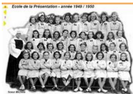
Photo : Ecole Présentation Année 1949-50