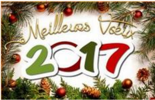
Les Vœux 2017 au Maarif (le 28/12/16)

A mes amis Maarifiens (nes) Noël est passé, j'espère que tout s'est bien déroulé et que les enfants et petits enfants ont été gâtés, à présent c'est le moment de vous présenter nos meilleurs vœux pour 2017 et surtout une bonne santé, c'est primordial avant toutes choses.