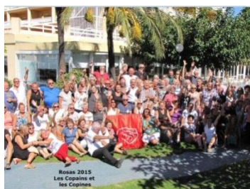
Dimanche 15H : Photos

Vendredi 15/09 bateau+ paella à Calla Joncols Cout : 30 euros par personne Prévoir l'appoint pour l'agence