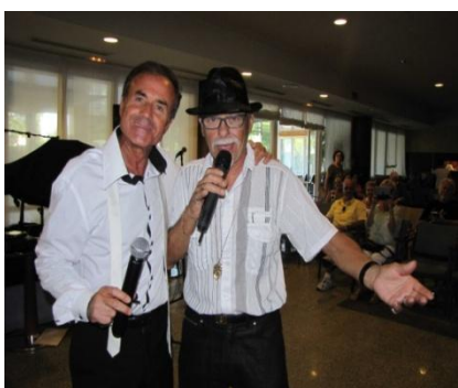
Dimanche 16h : Les Diavolos

Samedi 16/09 : 12h recueillement en hommage au PADRE dans le jardin de l'hôtel