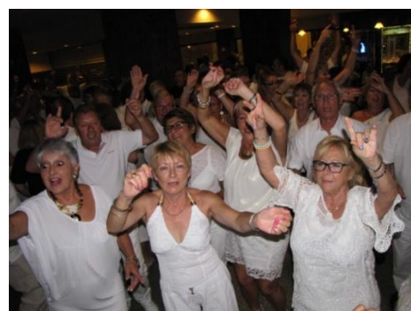
Dimanche 17/9 : Soirée blanche