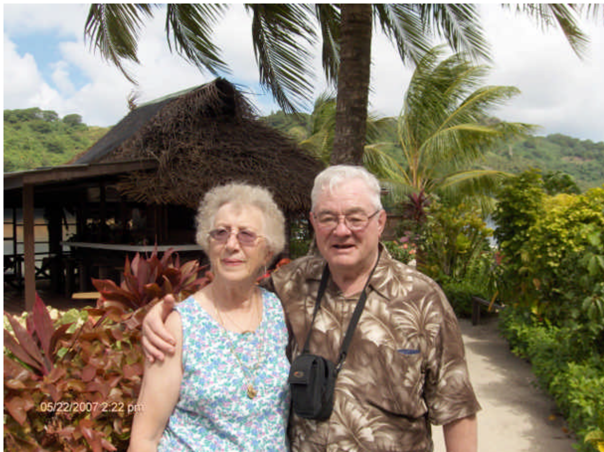
En Polynésie Française