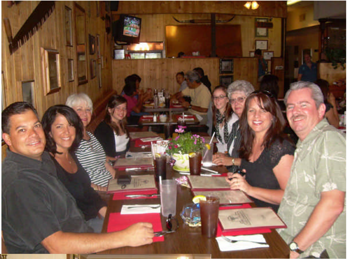
Fête des mères, avec mes enfants