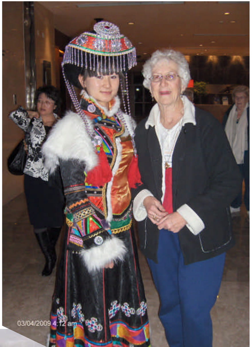
Notre voyage en Chine en 2009