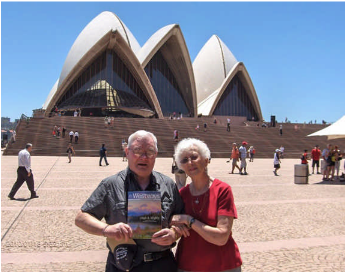
Devant le fameux Opéra de Sydney, Australie.