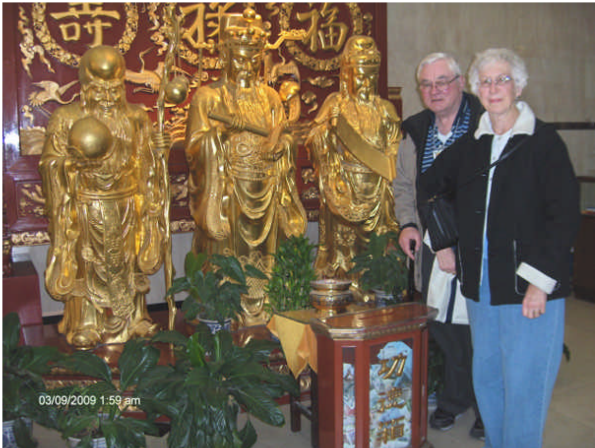
Notre voyage en Chine en 2009