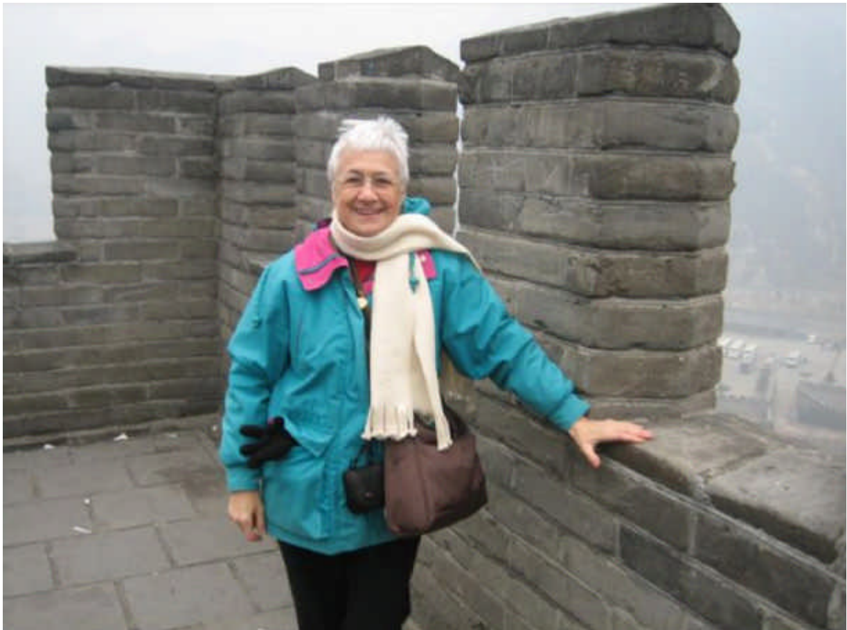
mon voyage en Chine, a la Grande Muraille en 2009.