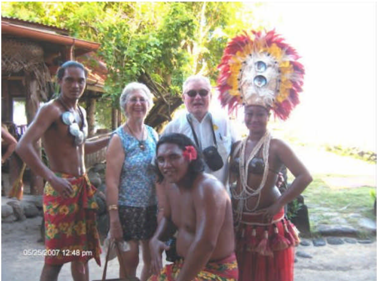
En Polynésie Française