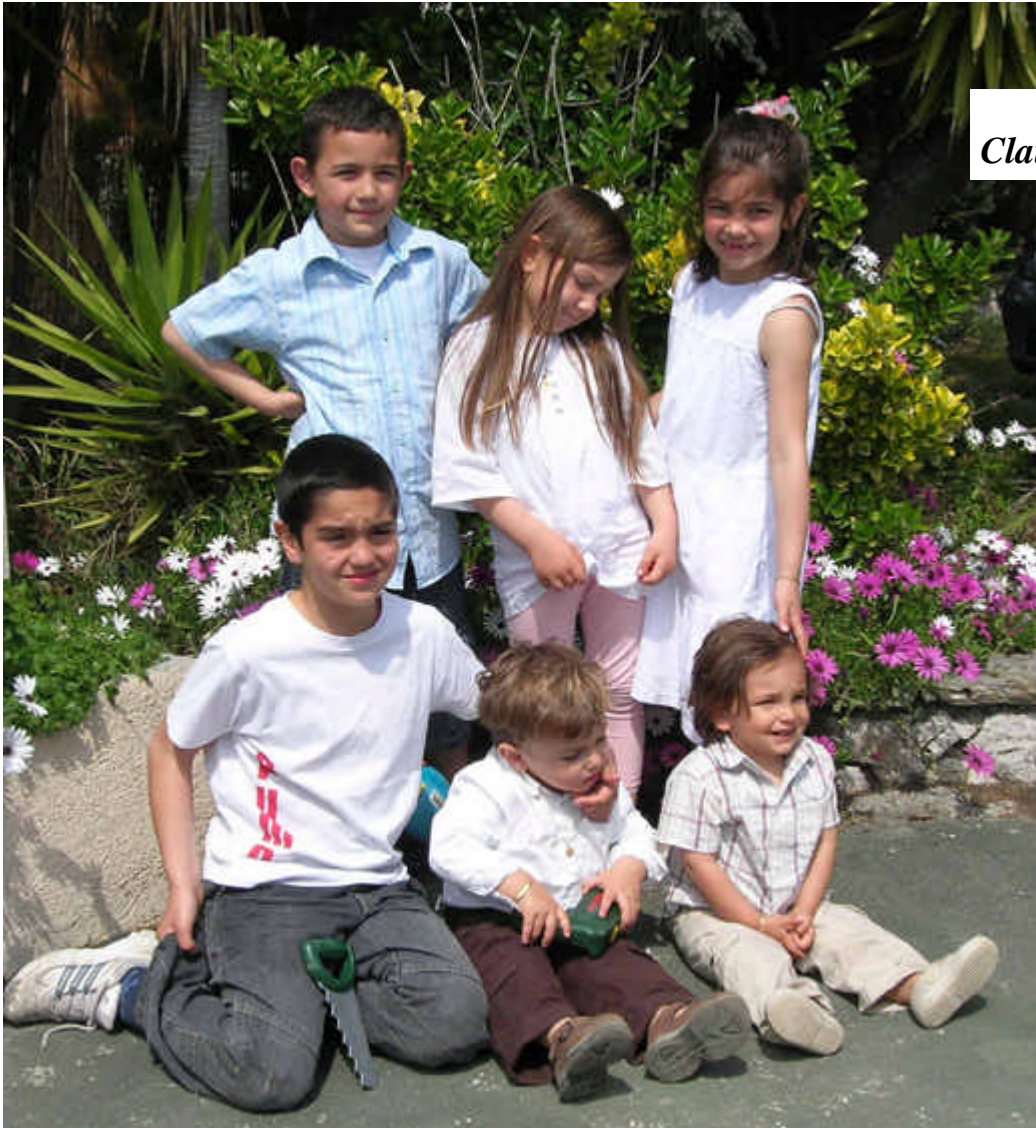
Petits enfants de Claude et Léonel Ventura: