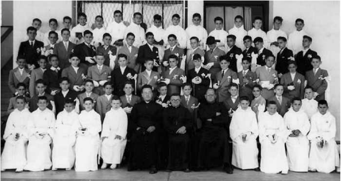
10 Mai 1956 Communions. Je suis au 2ème rang 3ème en partant de la droite