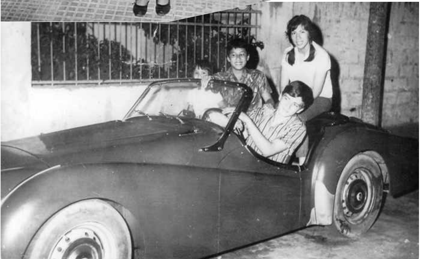
Mon père au volant et ma mère derrière