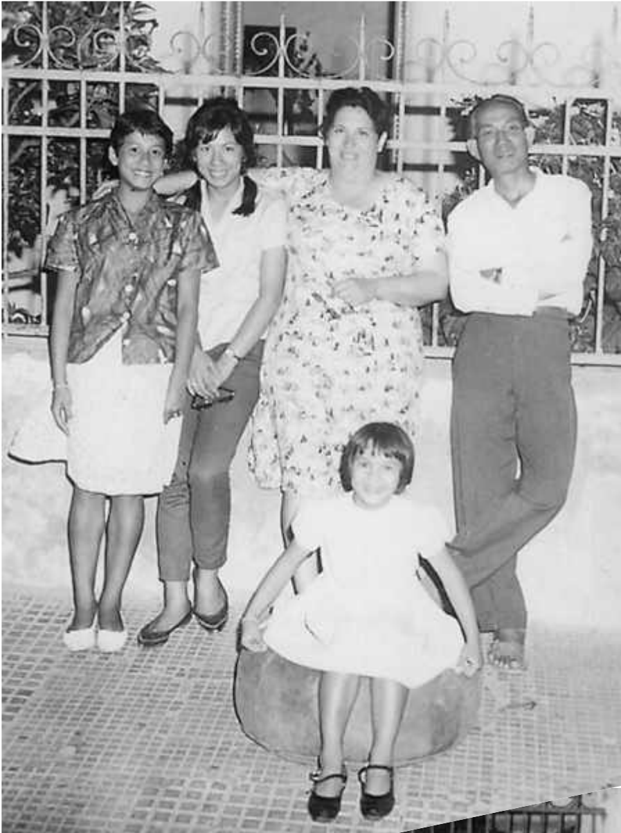
Ma maman inssi que ses parents et deux de ses sœurs Ma mère était au 37 rue de l'Esterel