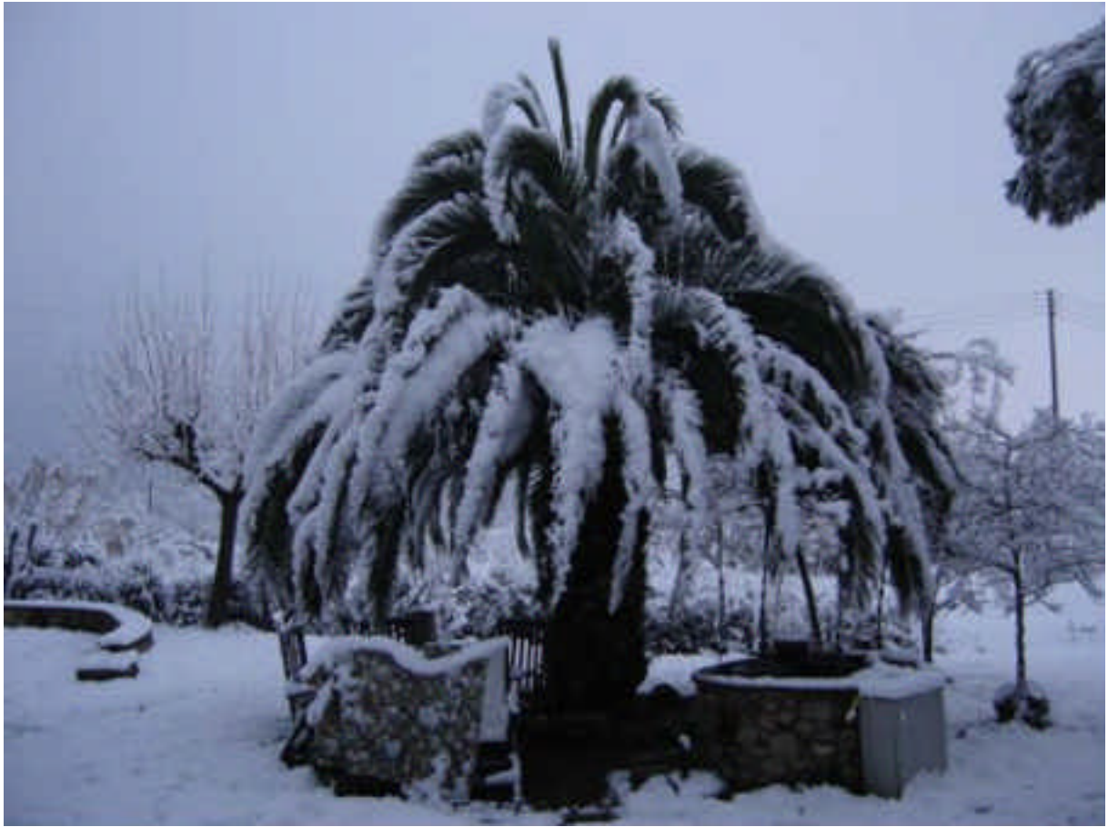
Chez moi le 06/01/09. C'est la première fois qu'il neige autant, à Breda/Girona