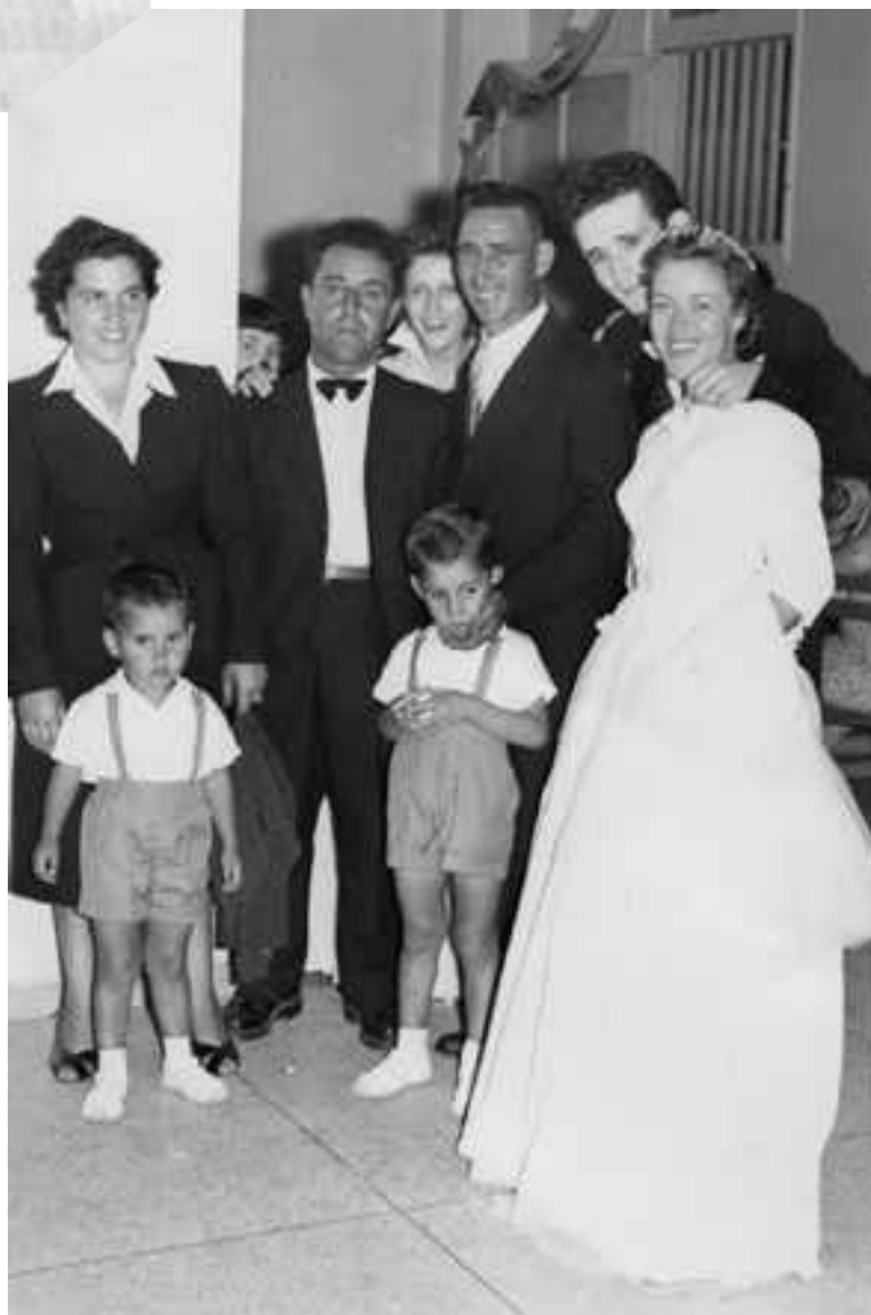
Mariage de Mme Cervera 1/09/56