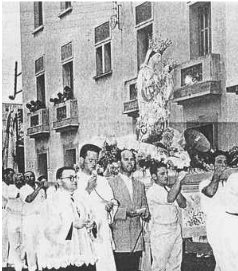
Procession du 15 Août 1957. Ici dans la rue du Jura