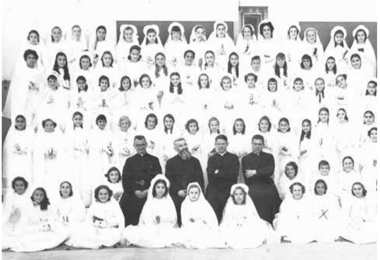
Communion selannelle en l'église Saint Antoine de Padoue - 1950