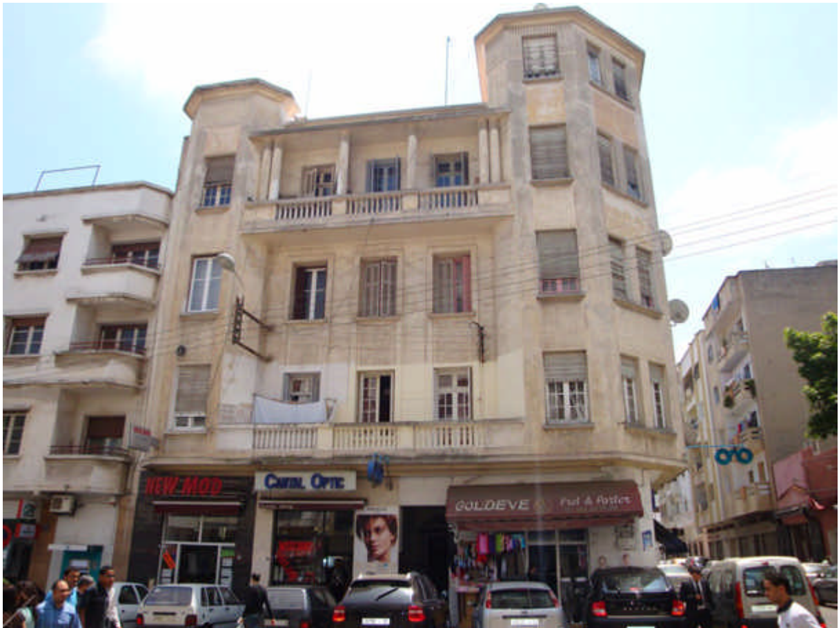
103 : pl du Cantal rebaptisée pl Babel : il y avait le coiffeur Immormino et la Cave à vin en allant vers le marché