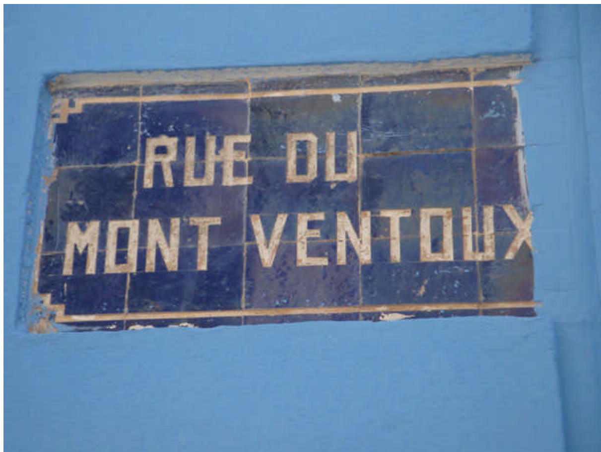
119 : Plaque de la rue du Mont Ventoux