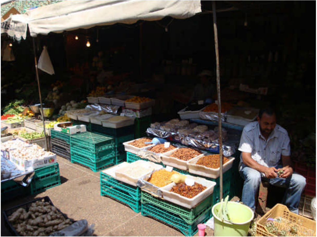
097 : notre marché : toujours aussi bien tenu