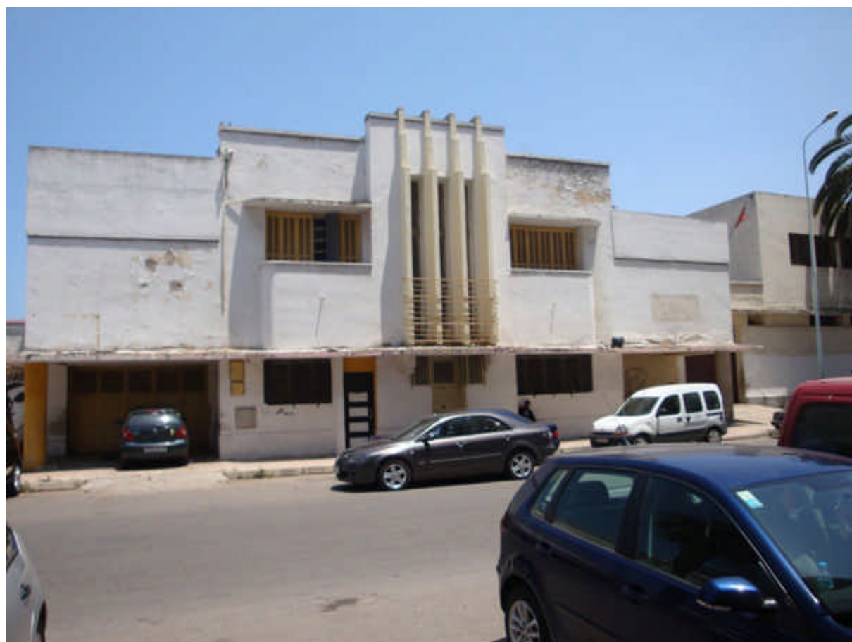
122 : école du Maarif - Côté filles