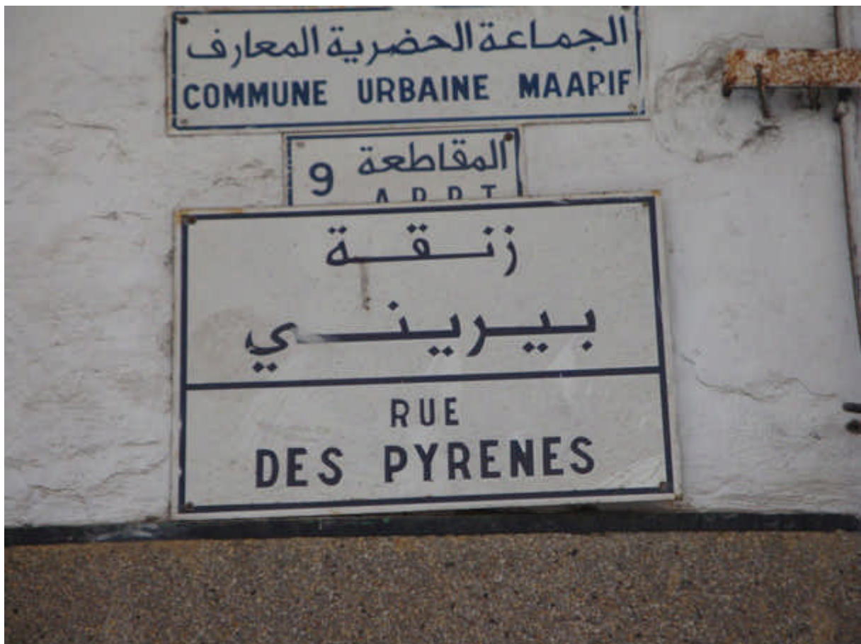
104 : Plaque de la rue des Pyrénées