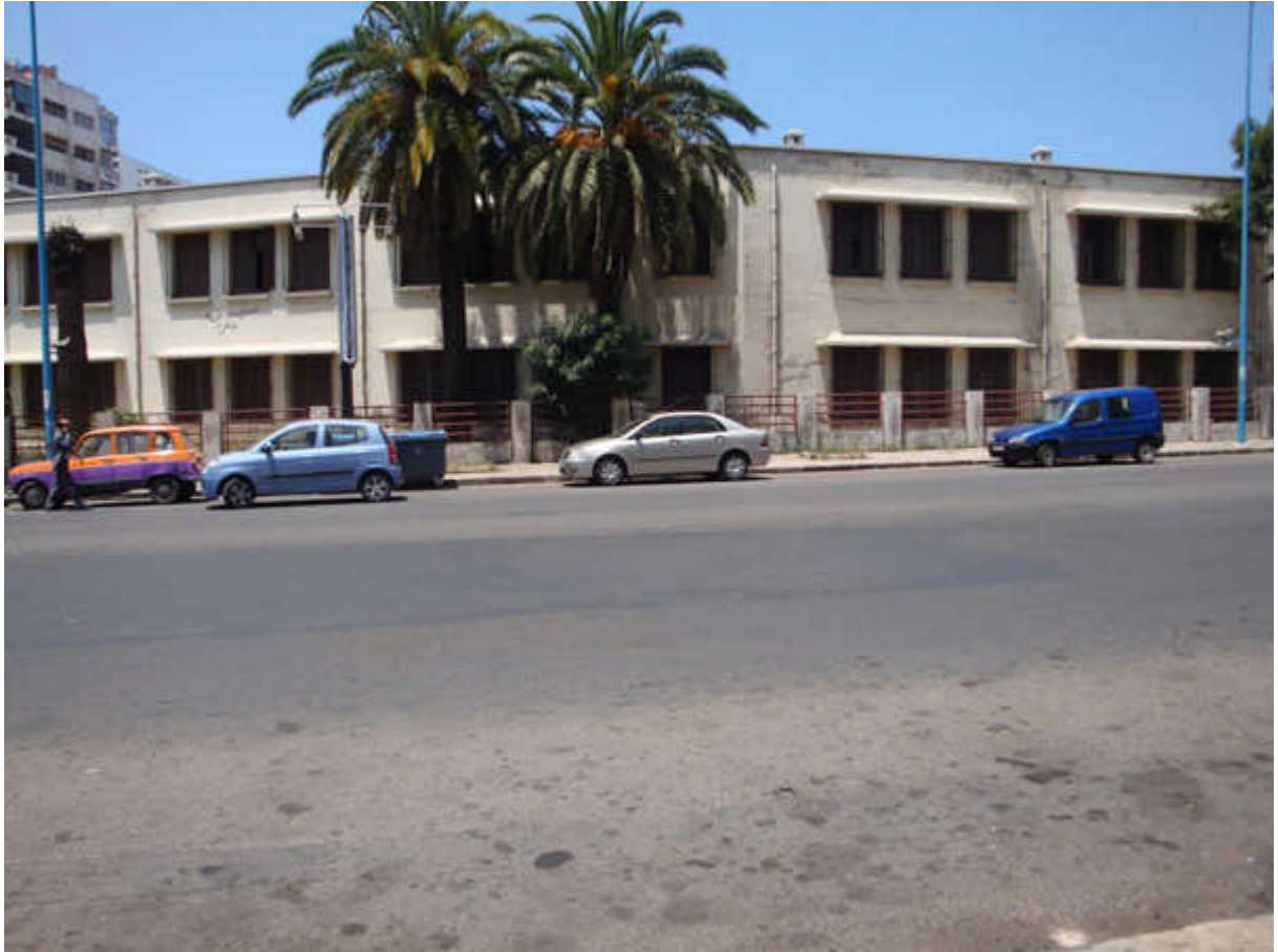
123 : école du Maarif