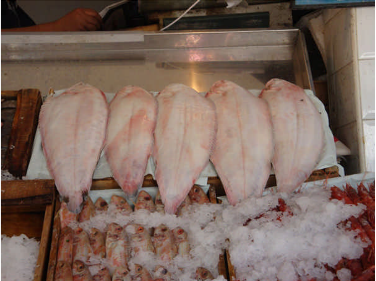
09 : notre marché : toujours aussi bien tenu