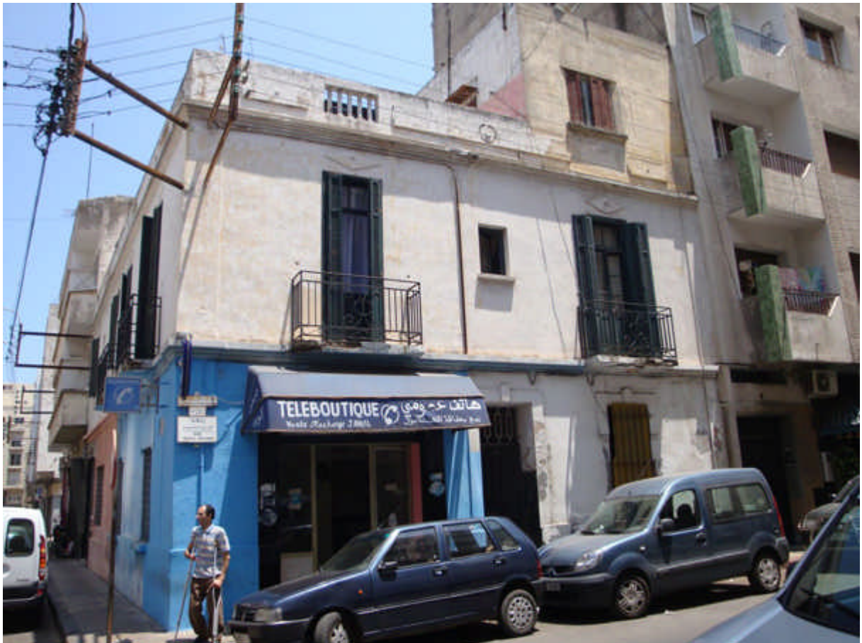
118 : Qui se reconnaît de ce côté ?