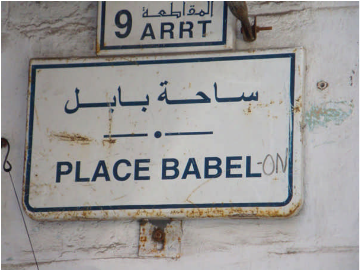
101 : place du Cantal rebaptisée place Babel