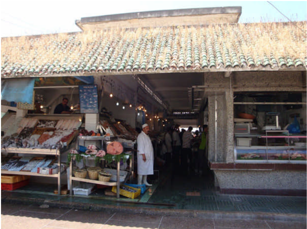
092 : notre marché : toujours aussi bien tenu