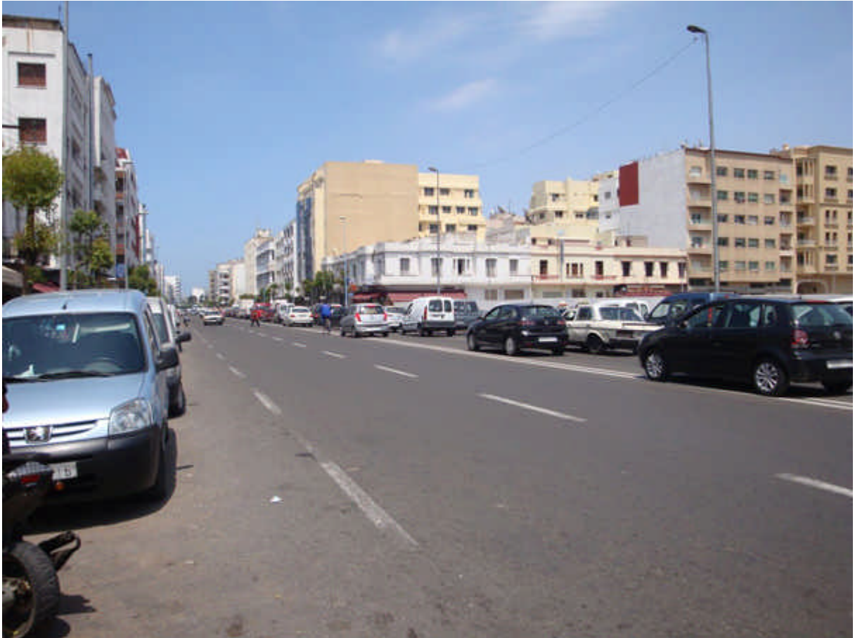
125 : bd Brahim Roudani, la pharmacie du Marif, ses célèbres cafés