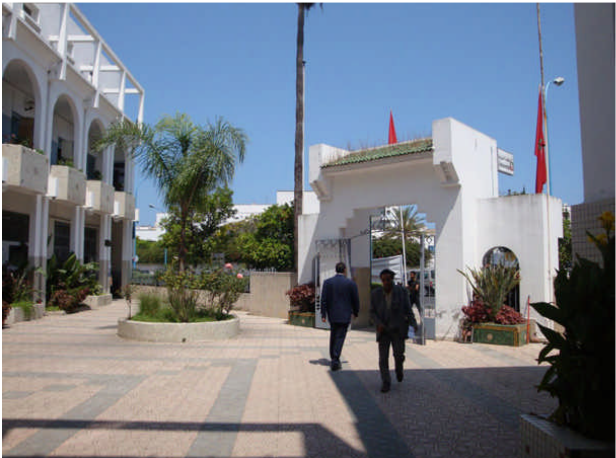
108 :l'intérieur de l'école des Soeurs de la Présentation