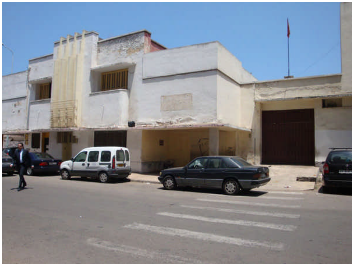
121 : école du Maarif - Côté garçons