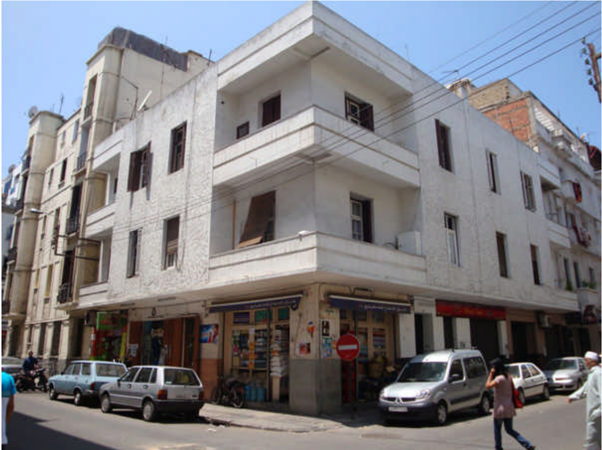
115: Un carrefour dans le Maarif