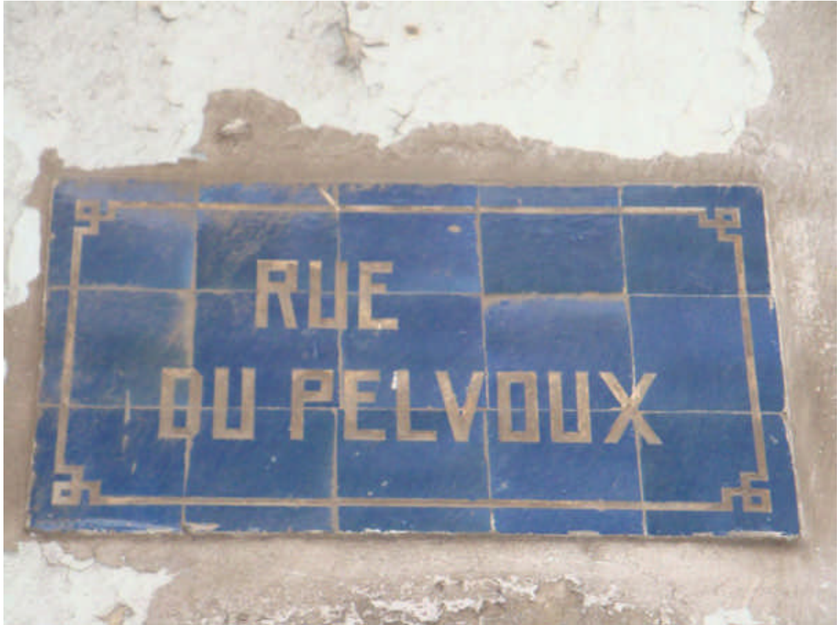
135 : Plaque accrochée sur le mur du 11 rue du Pelvoux