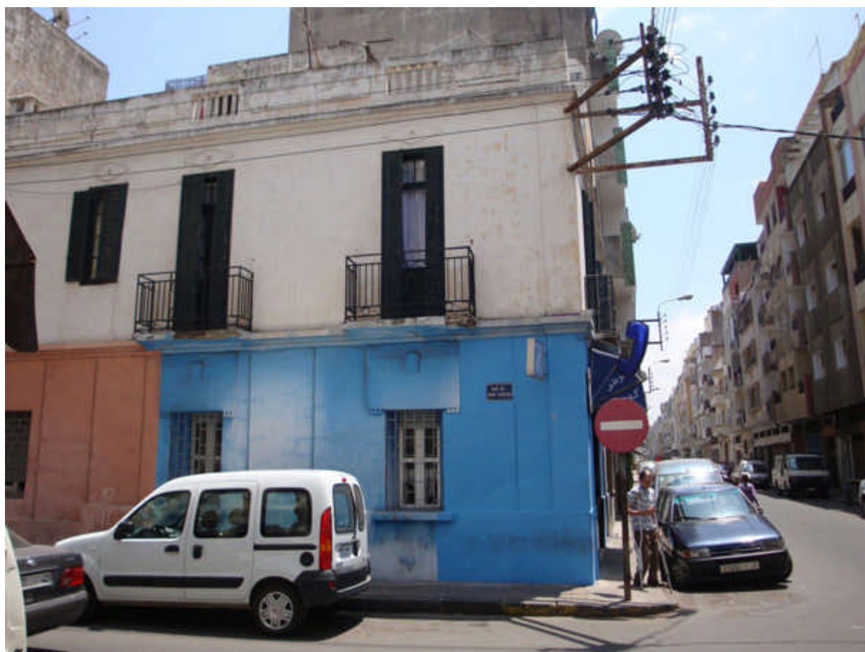
120 : Rue du Mont Ventoux