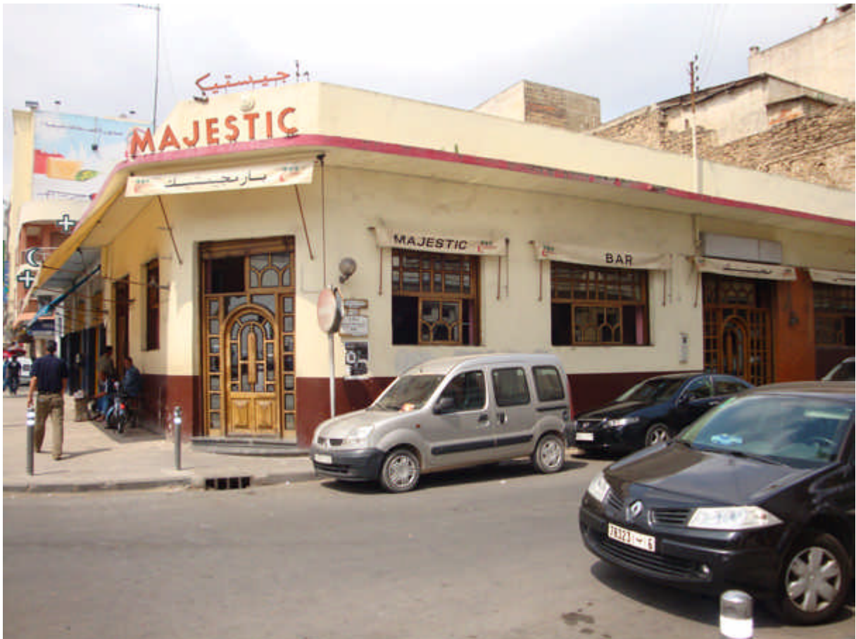
134 : bd Brahim Roudani. ses célèbres cafés : le Majestic