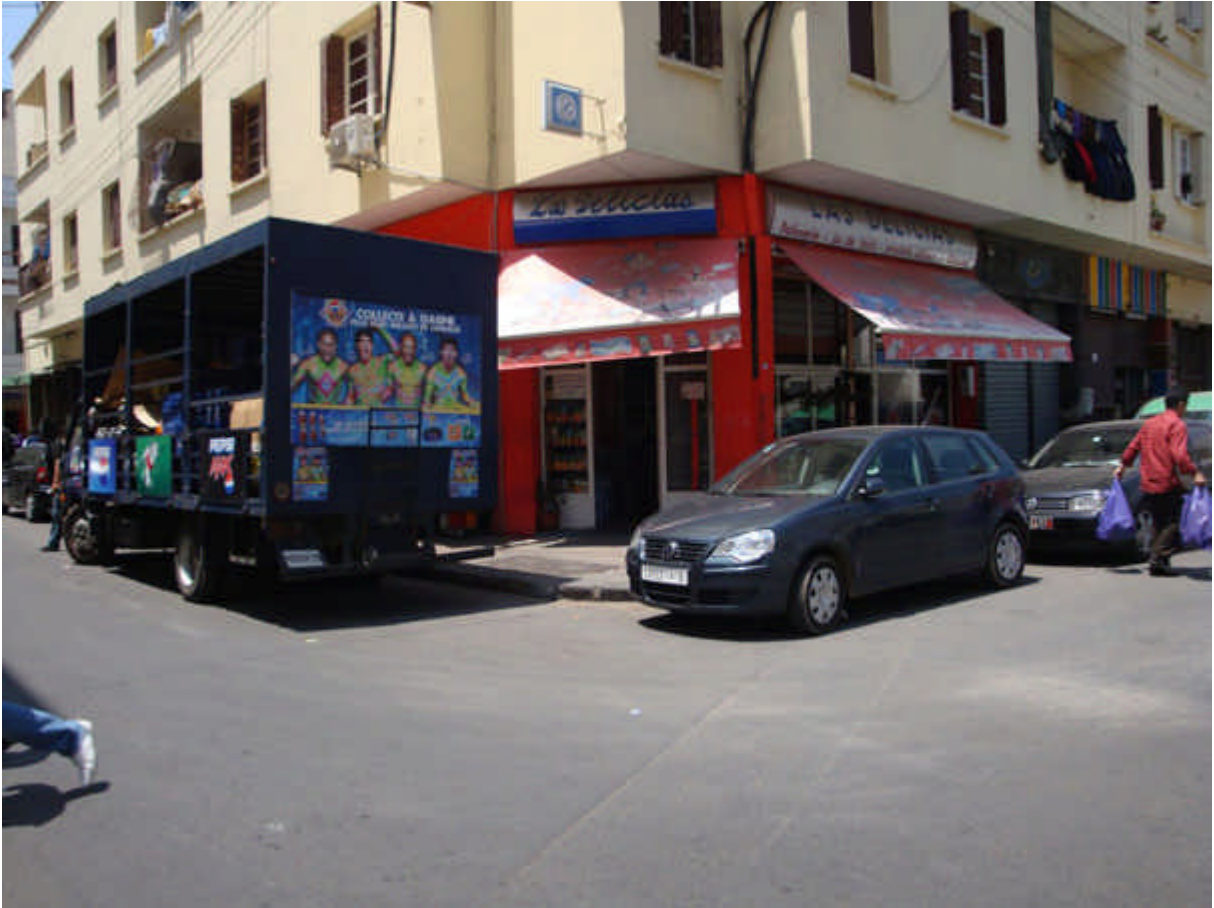
111 : "le coin", chez Ladouche