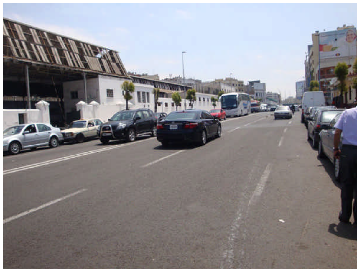
128 : bd Brahim Roudani, Le garage de la CTM. direction Bd Danton