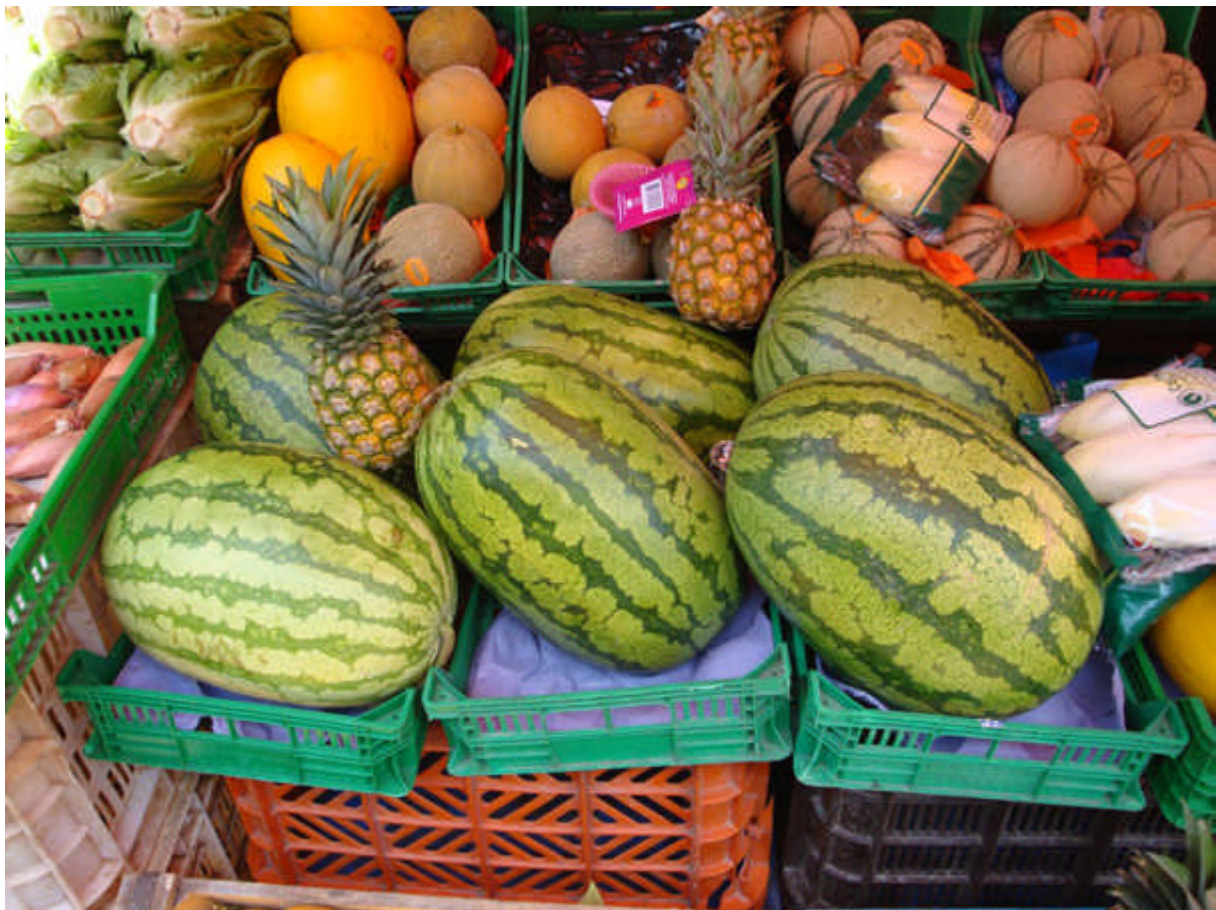
096 : notre marché : toujours aussi bien tenu