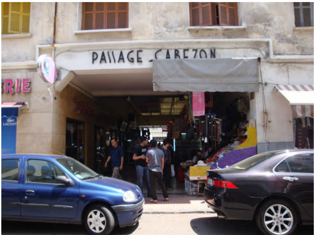
100 : le célèbre "passage Gabezon" qui nous paraissait si gd. Il n'y a plus le "chibani" qui vendait les épices