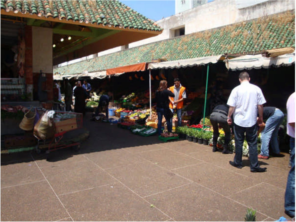
093 : notre marché : toujours aussi bien tenu