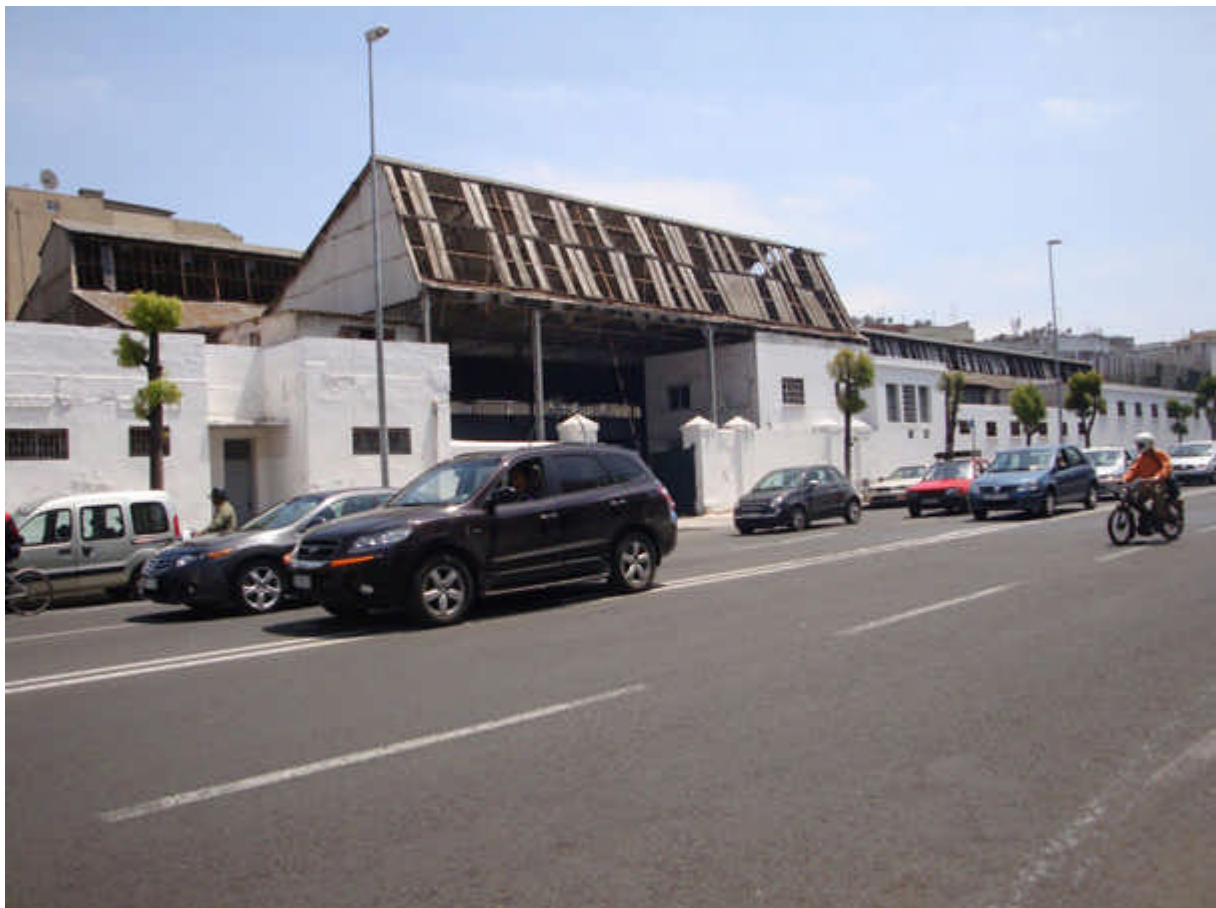
126 : bd Brahim Roudani, Le garage de la CTM