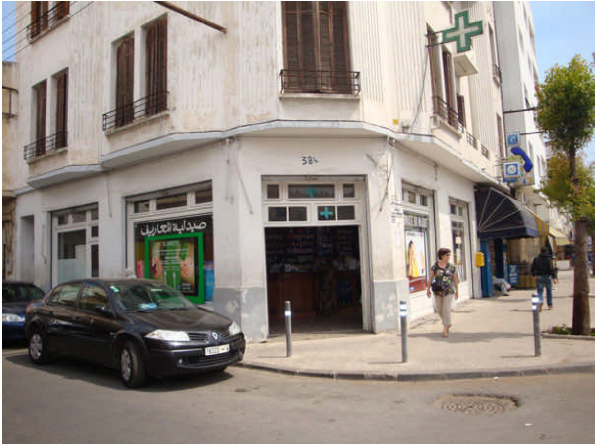
113 : Qui reconnaît l'endroit