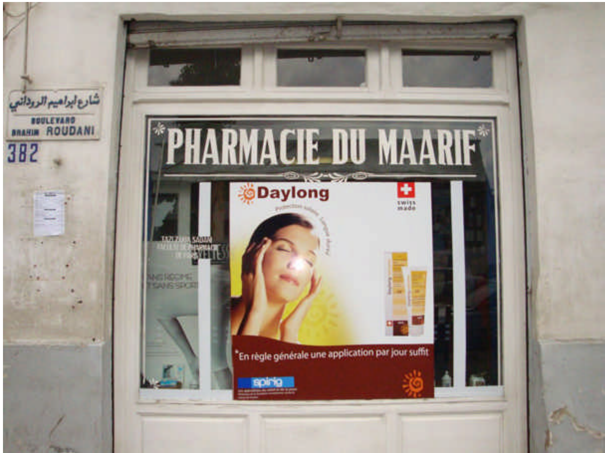
131 : bd Brahim Roudani, la pharmacie du Marif