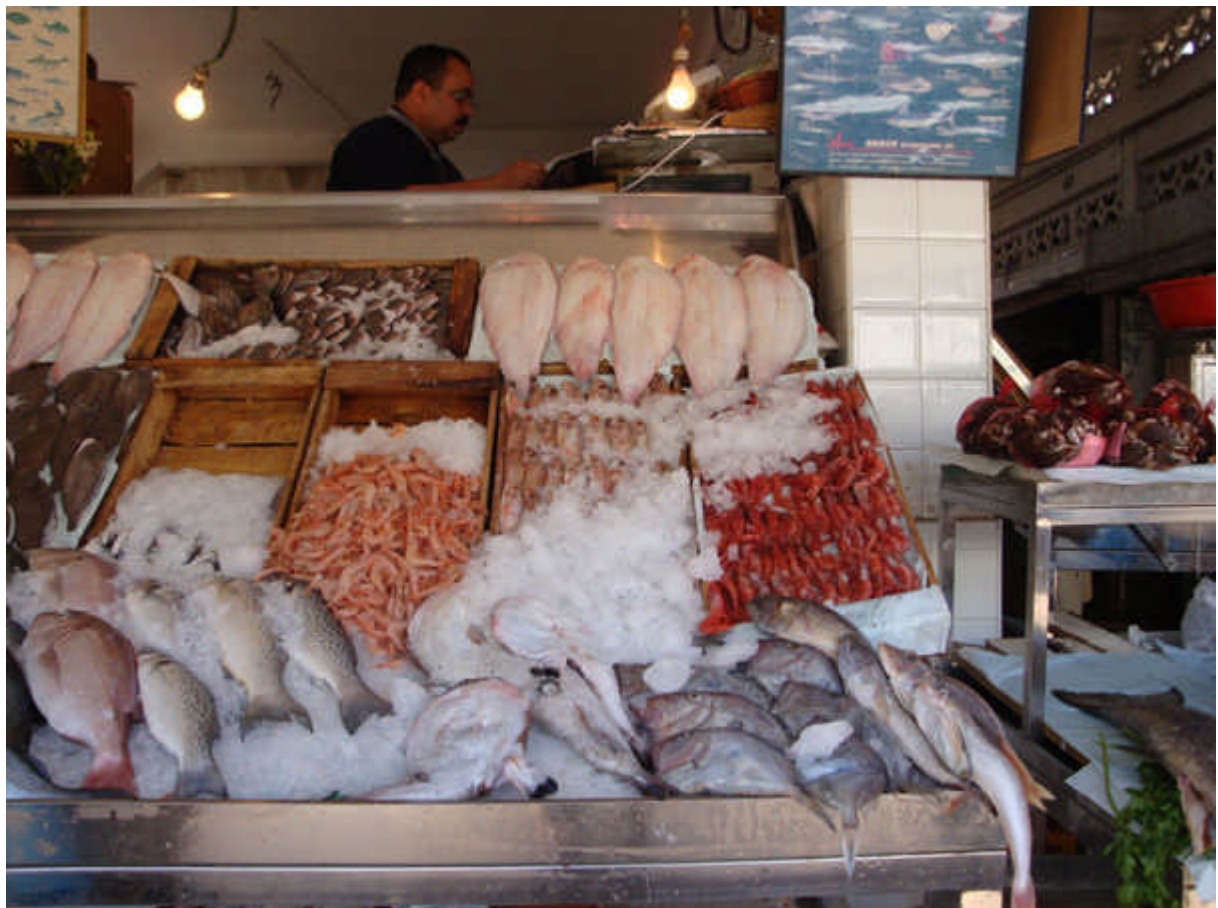
098 : notre marché : toujours aussi bien tenu