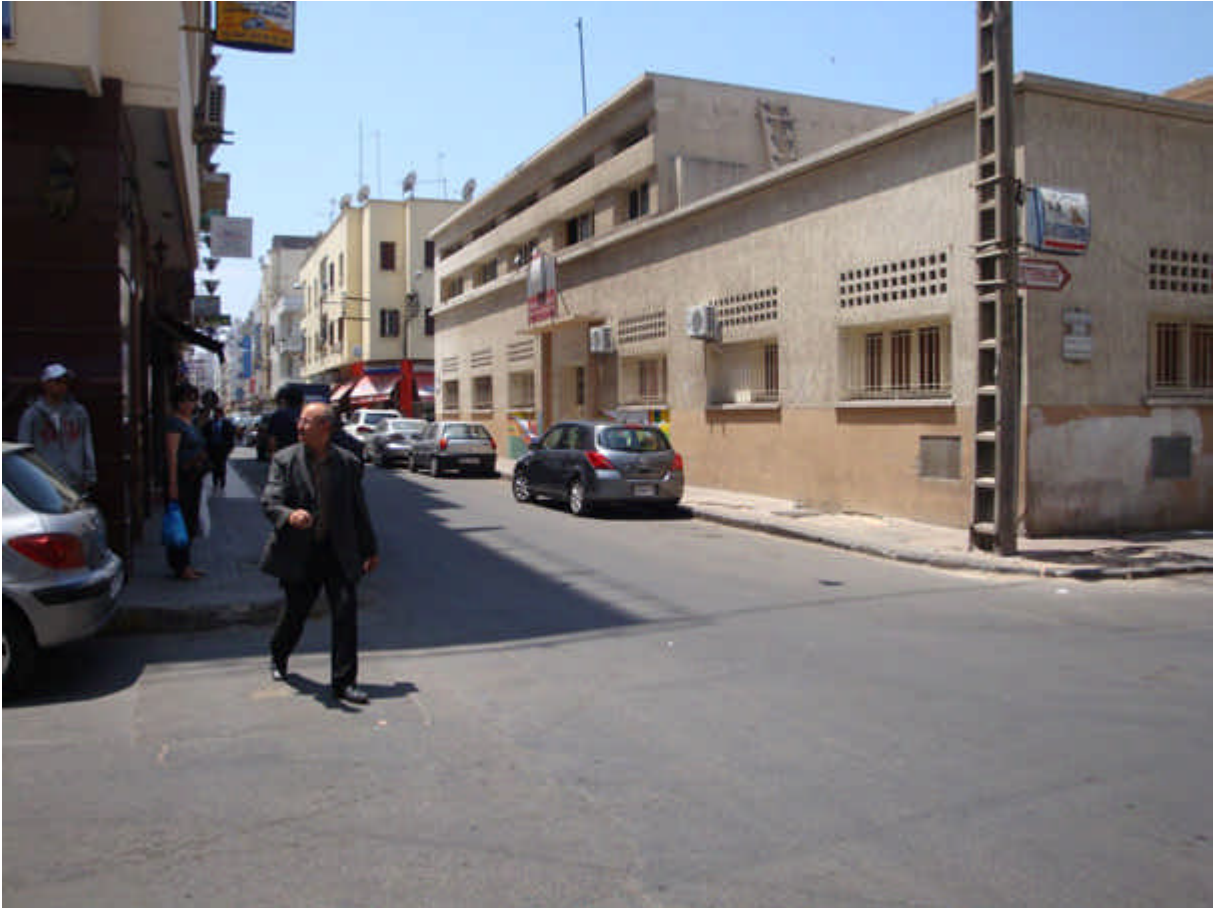
109 : école Dominique Savio