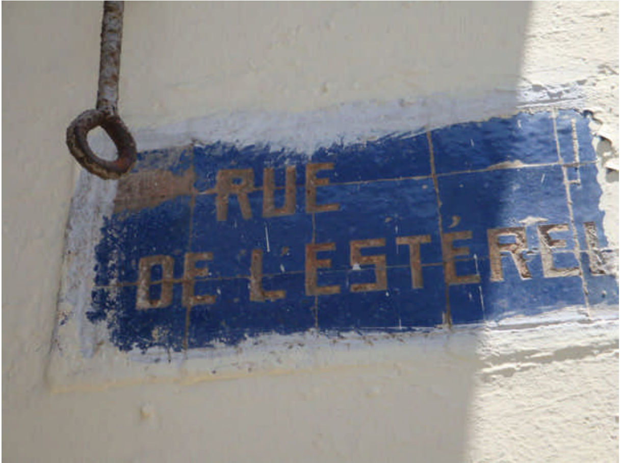
117 : Plaque de la rue de l'Esterel