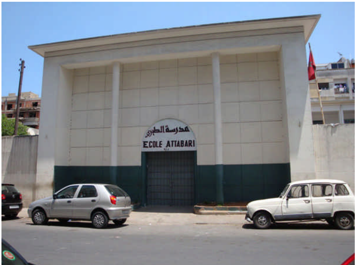
042 :110 : école Dominique Savio