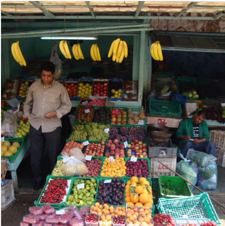
094 : notre marché : toujours aussi bien tenu