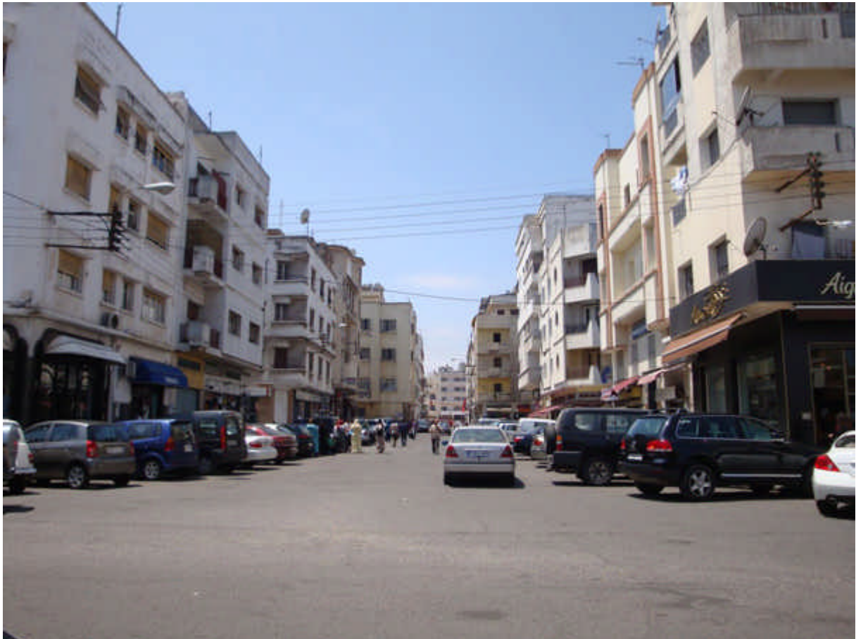
102 : pl du Cantal rebaptisée pl Babel : il y avait le coiffeur Immormino et la Cave à vin en allant vers le marché