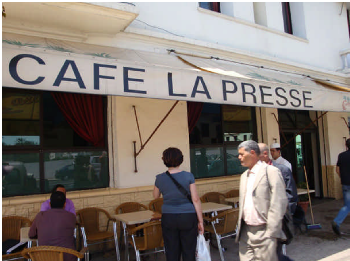
129 : bd Brahim Roudani ses célèbres cafés : Le Café de la presse