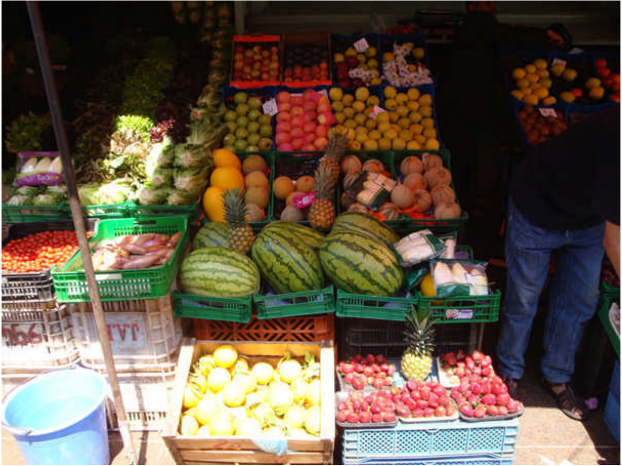
095 : notre marché : toujours aussi bien tenu