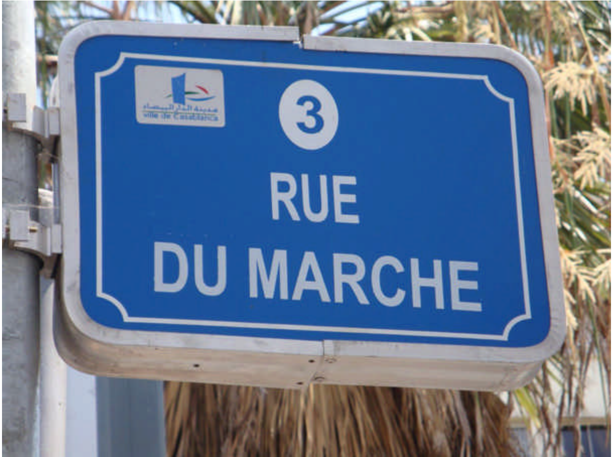
091 : Plaque de la rue du Marché