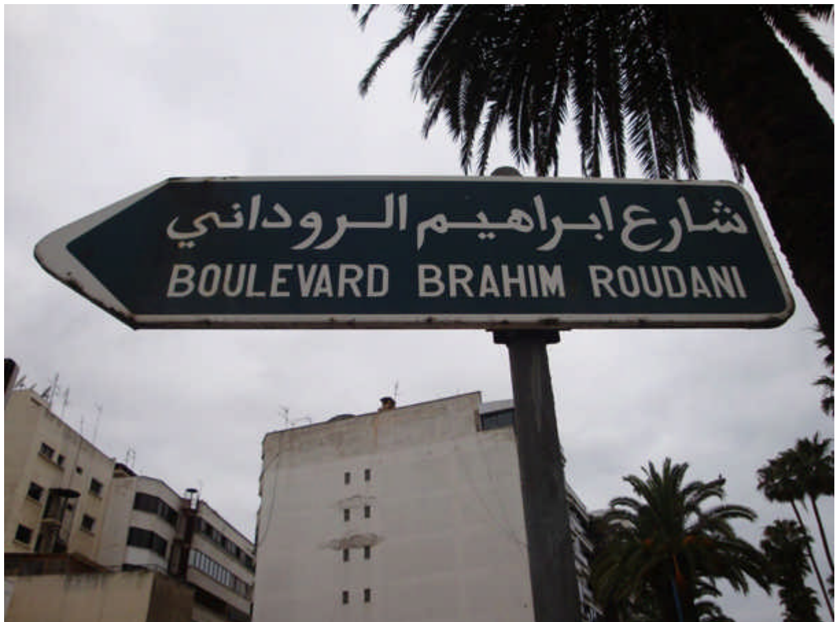
124 : bd Brahim Roudani