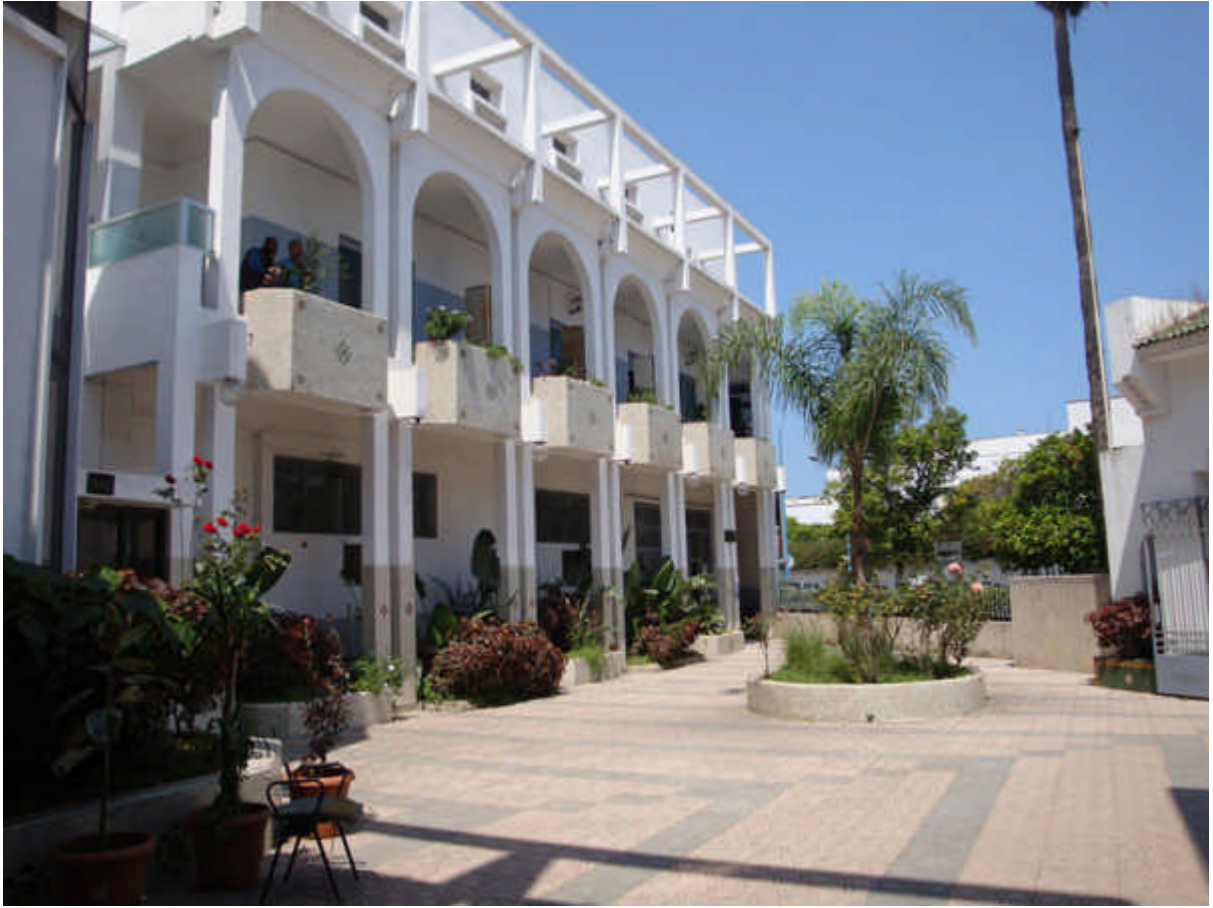
107 :l'intérieur de l'école des Soeurs de la Présentation