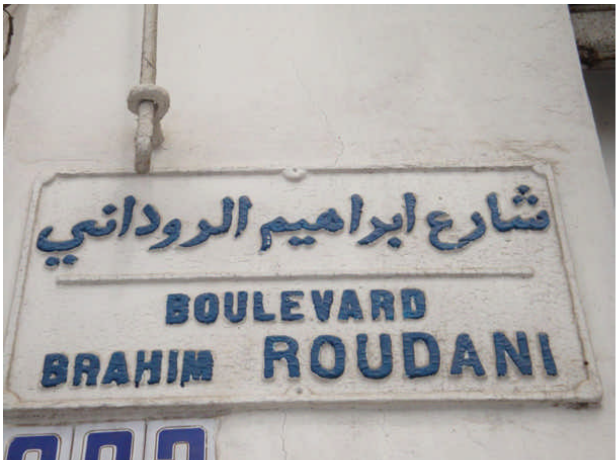
130 : La plaque du bd Brahim Roudani, (ex Bd Jean Courtin)