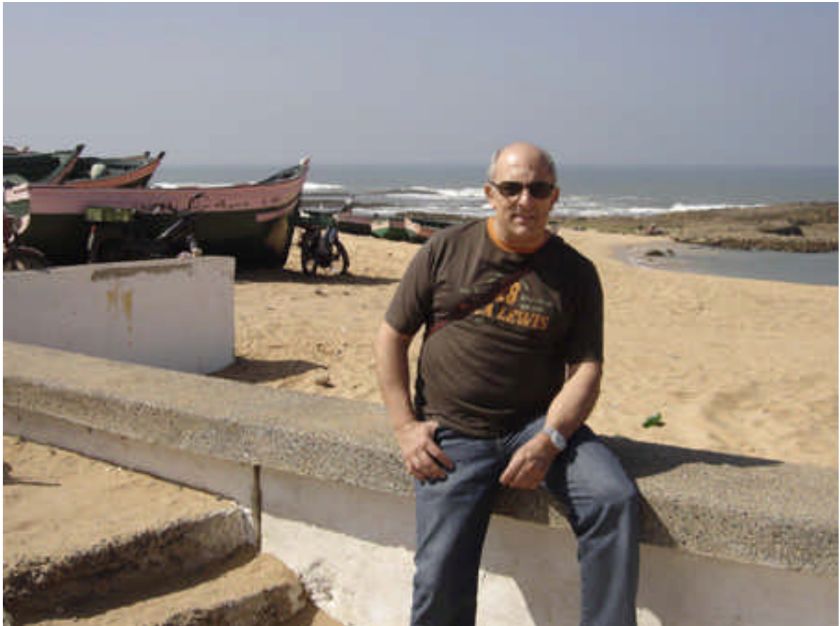
André Agosta : La piscine de Oualidia