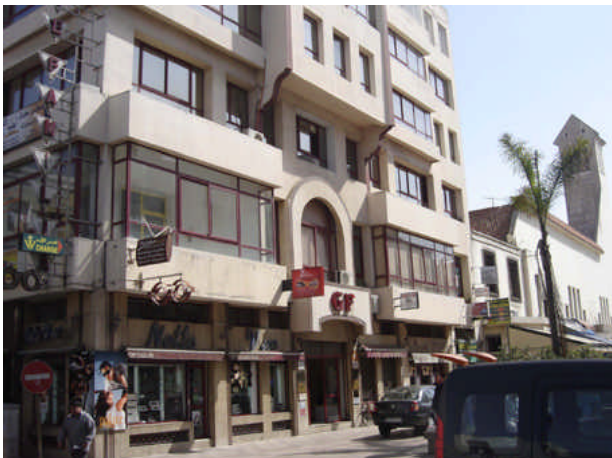
André Agosta : Immeuble à la place du Familia